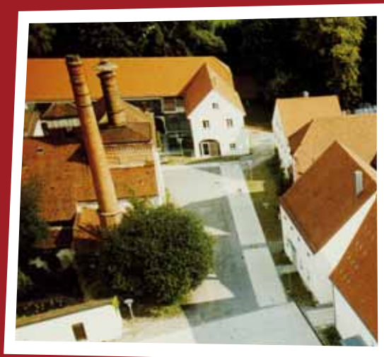
Ansicht der Schlossökonomie Gern http://www.schlossoekonomie.de

Die Schlossökonomie in Gern ist recht einfach zu finden. Fahren Sie vom Stadtplatz Eggenfelden aus Richtung Burghausen/Altötting, nach ca. 500m biegen Sie an der Ampel links Richtung Gern ab und folgen der Vorfahrtstraße. Schon sind Sie am Ziel.