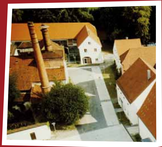
Ansicht der Schlossökonomie Gern http://www.schlossoekonomie.de